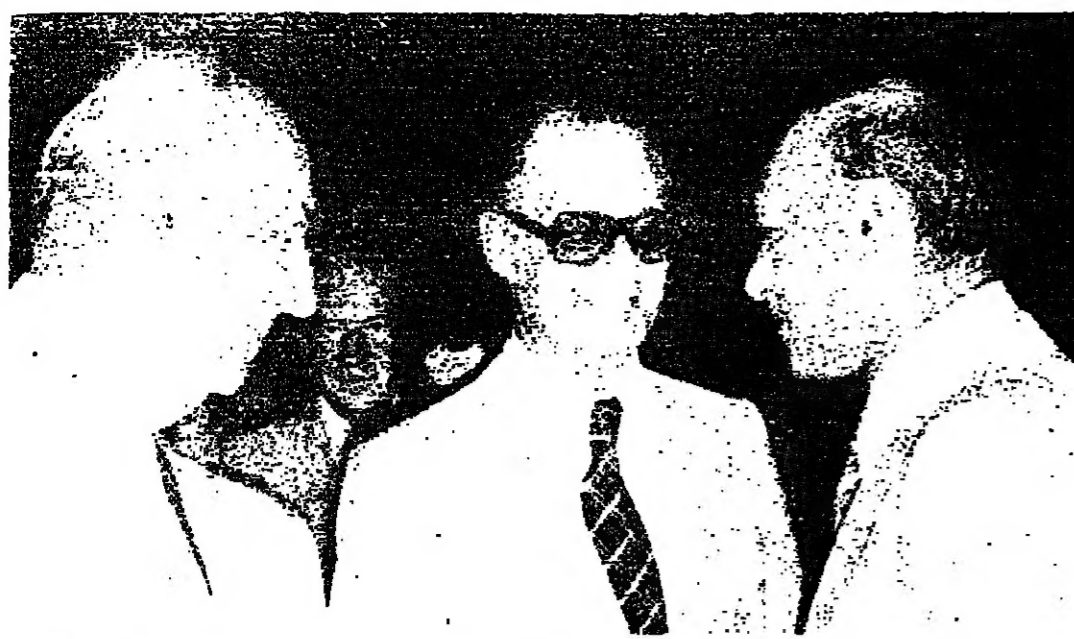
الرئيس الحص والوزير بطرس مع السفير الفرنسي (حضور بطوان غواد)